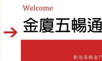
金廈五暢通接機牌