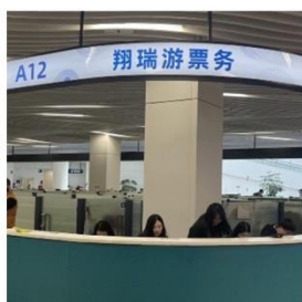
五通碼頭A12票務櫃檯