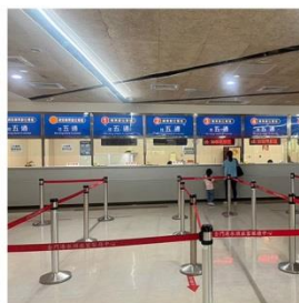
金門水頭碼頭船務櫃台