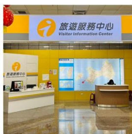
水頭碼頭旅客服務中心