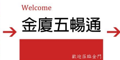
金廈五暢通接機牌